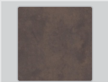
BROWN | MARRÓN