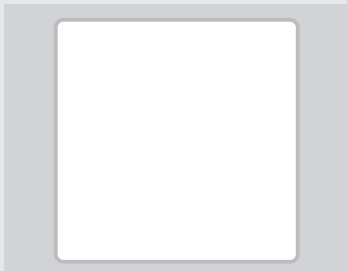
WHITE | BLANCO