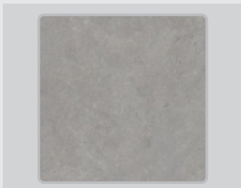
GREY | GRIS